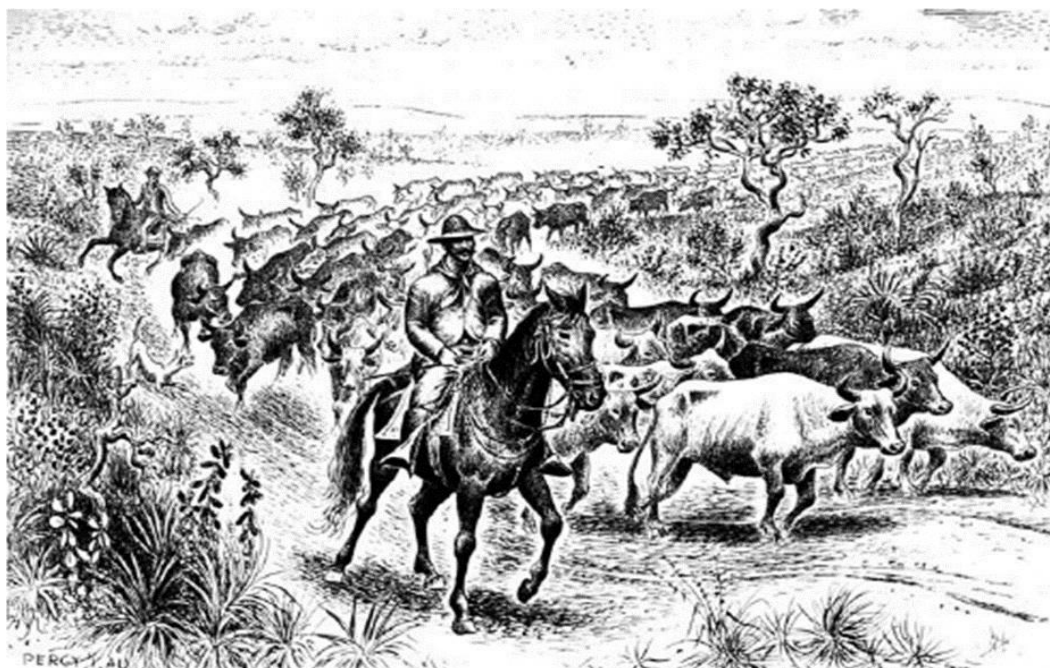
Imagem 4 - Boiadeiro e tropa