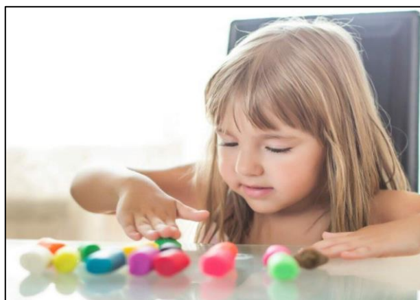
Figura 2 – Criança com TEA

A seguir na Figura 2, apresentamos um exemplo de jogo que pode ser feito.