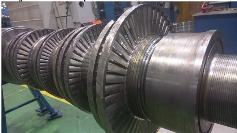
Figura 4 – Fileiras de palhetas do rotor

para as palhetas móveis do rotor. Diz, ainda, que a geometria das palhetas fixas é projetada com precisão para otimizar a conversão de energia, garantindo que o vapor entre e saia do estágio na direção e velocidade adequadas (Cardoso, 2017). Na figura 4 as fileiras de palhetas do rotor podem ser visualizadas.