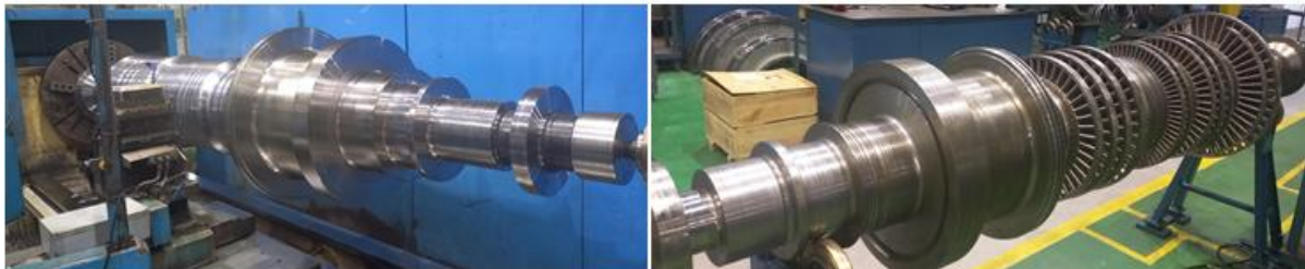
Figura 5 – Rotor no torno sendo usinado e na fase de montagem das palhetas

potência requerida na turbina (Cardoso, 2017). A figura 5 a usinagem do rotor e montagem das palhetas.