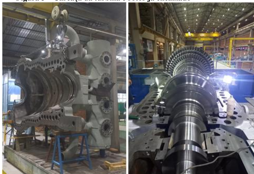
Figura 3 – Carcaça da turbina e rotor já encaixado

As palhetas são impulsionadas pela força motriz do vapor, fazendo o rotor vinculado ao gerador de energia girar, gerando a eletricidade. A fixação das palhetas ao eixo varia entre os fabricantes, sendo as configurações mais comuns o rabo-de-andorinha e o rabo-de-andorinha invertido, e o corpo da palheta é chamado de aerofólio (Cardoso, 2017). A figura 3 mostra carcaça da turbina e um rotor já encaixada nesta turbina.