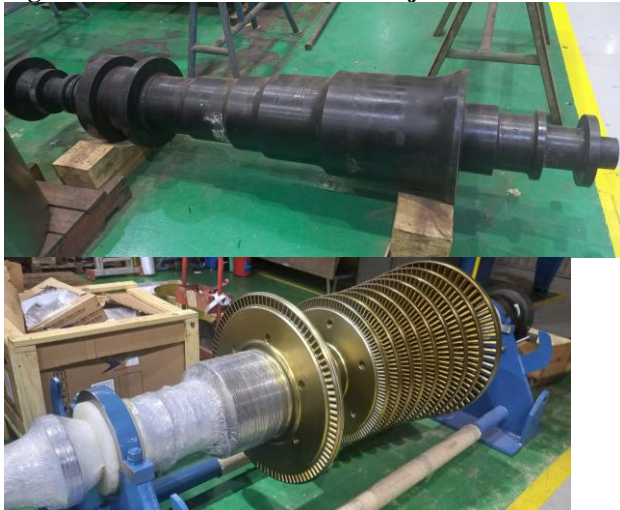
Figura 2 – Rotores cru somente forjados e finalizados para o cliente

O rotor, também conhecido como roda, é composto por um conjunto de palhetas dispostas em torno do eixo da turbina, organizadas em fileiras. A figura 2 permite visualizar dois rotores forjados.