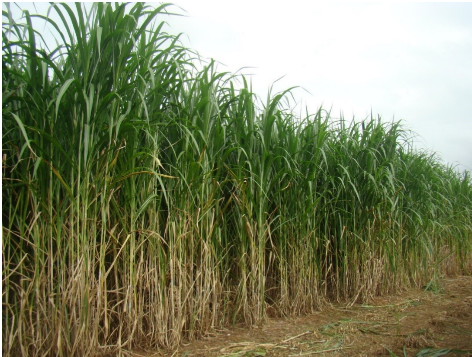
Figura 1. Capim Elefante. PEREIRA (2016).

É uma gramínea perene e de um crescimento cespitoso, podendo atingir de 3 a 5 metros de altura (Figura 1). Seus colmos são eretos e dispostos em touceiras com rizomas curtos. As folhas podem medir até 10 cm de largura e 110 cm de comprimento. Elas possuem uma nervura central larga, bainha lanosa, fina e estriada, e lígula curta e ciliada (ROSA et al., 2019).