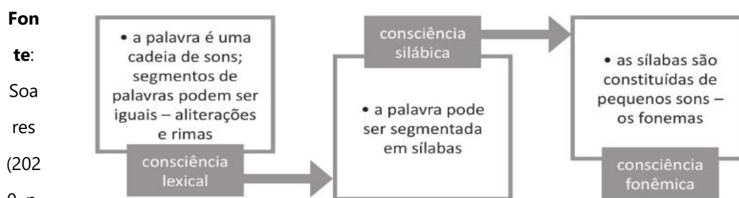
Figura 02: Consciência Fonológica

Conseqüentemente, na apropriação da escrita, as crianças passam a entender que, a escrita presente em um livro lido em voz alta para ela, representa aquilo que ela ouve. Soares (2020) denomina esse processo como consciência fonológica, conforme a figura 2 apresenta: